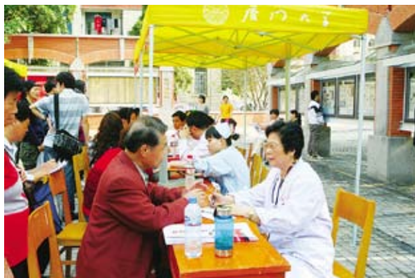
“健康快车”进厦大校园为师生义诊