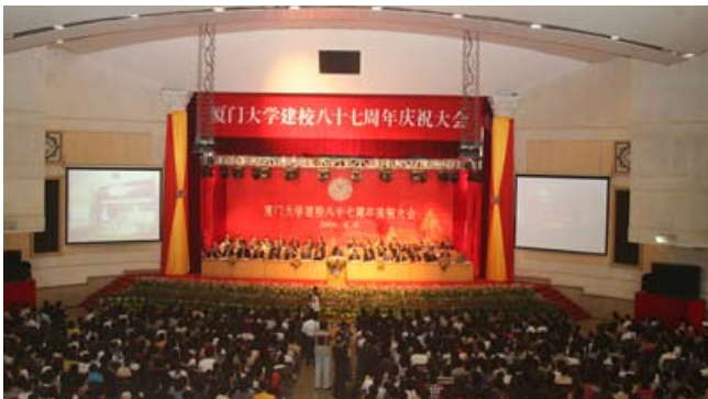
厦门大学建校87周年庆祝大会会场