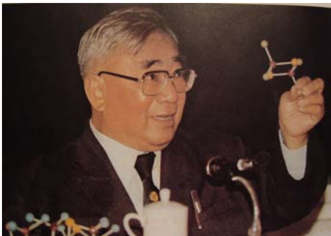
卢嘉锡教授在做学术报告