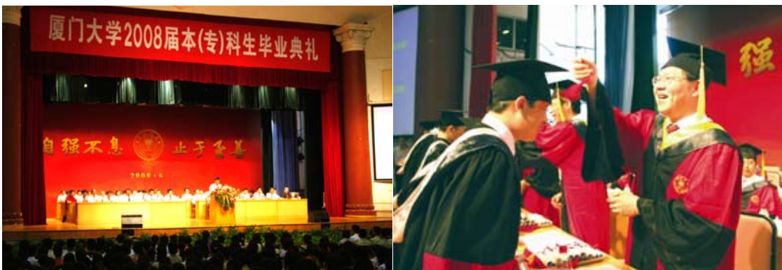
左图：2008届本（专）科生毕业典礼会场；右图：朱崇实为毕业生拨正学位帽流苏。

6月27日上午，我校2008届本（专）科生毕业典礼在建南大会堂隆重举行。校领导朱之文、朱崇实、潘世墨、孙世刚、吴世农、邬大光、赖虹凯，中科院院士田中群教授，著名经济学家、管理学院葛家澍教授，校党委常委白锡能，校长助理庄宗明、王巧萍、韩景义、叶世满、李初环，各职能部门以及各院领导在主席台就座。典礼由党委副书记辜芳昭主持。