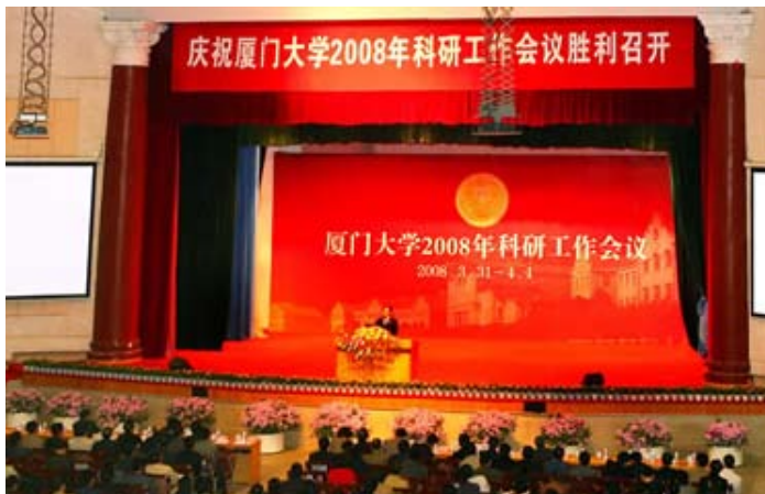
2008年度学校科研工作会议会场