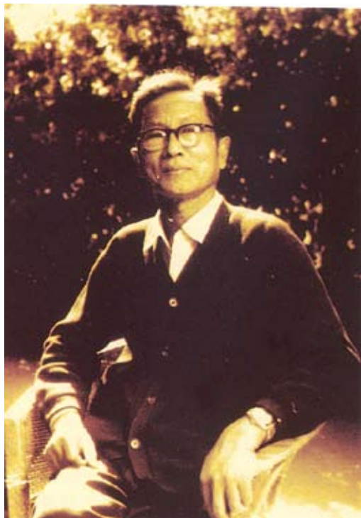
在省干休所疗养的李法西教授

1978年4月，已过耳顺之年的厦大海洋系李法西教授作为中国海洋科学考察团的成员和副团长，赴美考察海洋科学研究并洽谈中美海洋科技协作事宜，筹备中美合作长江口及毗邻陆架沉积作用过程调查研究课题。考察团沿着美国的海岸线，自东而西，参观了各重要的海洋科研基地，与美国的海洋科学家广泛接触、交流。回国后，受托在北京香山饭店总结此行的收获，提出我国海洋科学研究方向的建议。他分析接触过的美国海洋化学家的科研成就，为我国派遣留学生选择导师提供参考。他认为我国海洋科学研究的理论水平并不逊于美国同行，但科研手段较为落后，因此，我们既不能自卑，又要有自知之明。学习他人的先进经验，最重要的是有计划、有目的地派遣留学生并加强与外国科学家的协作。他说：“我们应该帮助留学生选择第一流的导师，学习当代第一流的科研本领。如果有计划地派留学生求学于国外第一流的海洋科学家，则当他们学成归国后，就可以集世界第一流科学家的成就之大成，合一炉而冶之，开辟更灿烂的科研前程，我国的科研基础就更加雄厚了。”