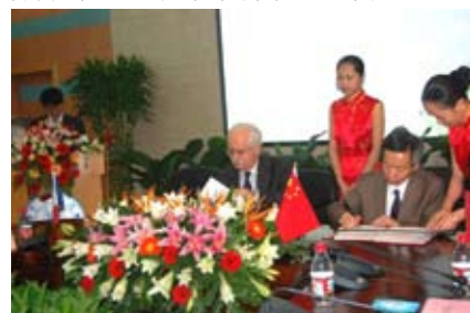
2006年,与法国国家科研中心及巴黎高等师范学校签订共建协议

学院注重学术交流和国际合作,近年办学国际化已迈出可喜的步伐。学院在产业化平台建设上也取得重要进展,“醇醚酯化工清洁生产国家工程实验室”和“教育部电化学工程中心”获准筹建。丙谷二肽获国家药监局颁发的药品生产许可证并正式投产;“循环流化锅炉工艺控制技术”已在3家大型企业应用,节能减排效果良好;“乙烯基吡咯烷酮和聚乙烯吡咯烷酮”项目通过了中试,实现了工业化。