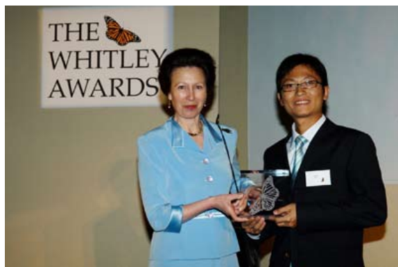
英国安妮公主（左）为刘毅颁奖