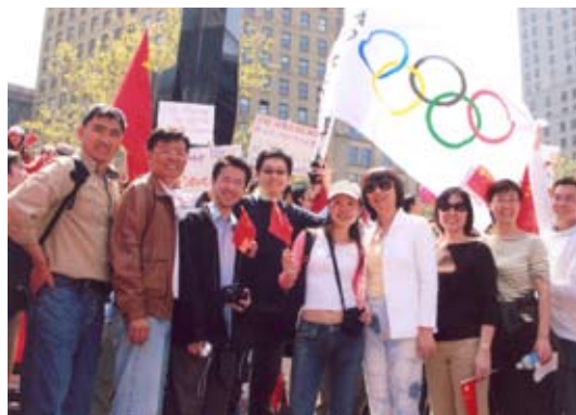
77级催化校友在集会现场合影

5月4日，厦门大学77级催化专业的在美校友参加了在纽约举行的“支持北京奥运”游行集会。为参加这次集会，他们精心制作了一面旗帜，在这面旗上有参加这次集会的部分校友及其家人的签名。活动过后，他们还通过邮寄，将这面旗传递给了在其他美国城市参加支持北京奥运活动的77级校友，旗上也留下了他们的签名。