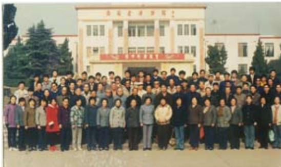
1984年，合肥校友会活动留影