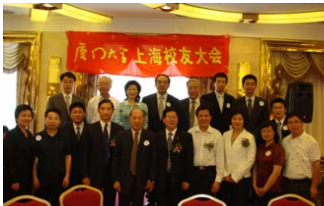
朱崇实(前右五)、王豪杰(前右四)、陈鹏生(前右六)与新一届上海校友会理事会成员合影。

5月18日，厦门大学上海校友会2008年校友大会在上海金玉兰顺风大酒店隆重举行，厦门大学校长朱崇实、厦门大学校友总会理事长王豪杰等专程赴沪参加。大约500名上海校友欢聚一堂，共叙情谊，热烈而温馨。