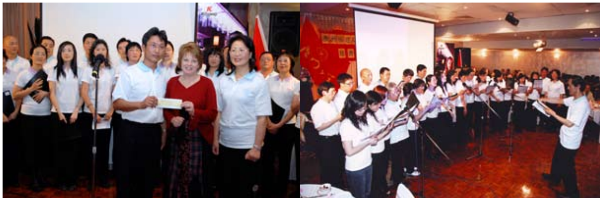
图为澳大利亚校友在千人慈善赈灾募捐晚会上表演节目

6月27日，由厦门大学澳大利亚校友会参与主办、安琪校友担任总策划和主持、澳大利亚福建籍社团联合举办的千人慈善赈灾募捐晚会盛况空前，圆满成功。厦门大学澳大利亚校友会共有120多位校友参加了此次晚会，充分体现了校友会的凝聚力和集体的力量。