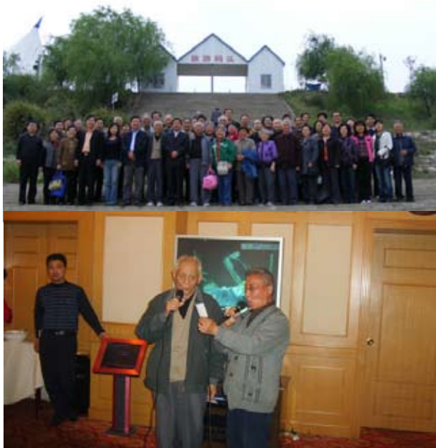
上图：校友们在花亭湖畔合影留念；