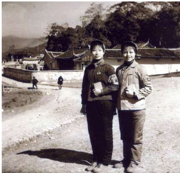
当年参加步行串连的女红卫兵

那么，三趟上北京是怎么回事呢？小陈第一次上北京是在1966年9月，即伟大领袖第三次接见红卫兵时。那次，她是在班级党支部的组织下，全班同学一起上北京的。9月15日下午5时许，伟大领袖接见了他们。那天傍晚，由于她站在天安门广场烈士纪念碑附近，距离伟大领袖