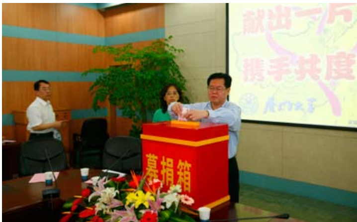
校领导带头向地震灾区捐款

5月14日，校党委发出通知，要求全校各级党组织积极响应党中央的号召，迅速行动起来，动员全体共产党员和广大师生员工以实际行动全力支援地震灾区的抗震救灾工作。得到全校党员、师生员工的积极响应。截止5月27日下午，师生捐款总额达400多万元。其中，党员缴纳的“特殊党费”80多万元，“情系灾区·党员献爱心”捐款20多万元。此外，广大厦大学子还以义演、义卖等形式为灾区募款。