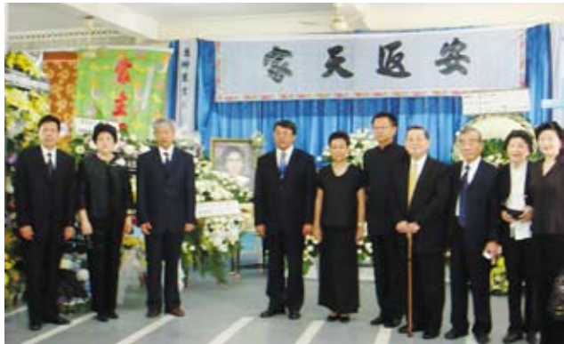
母校代表团与部分校友在蔡悦诗学长出殡仪式上

厦门大学泰国校友会创会主席、永远荣誉主席、厦门市荣誉市民、厦门大学杰出校友蔡悦诗学长，因病医治无效，于2008年5月31日凌晨5:30在曼谷不幸辞世，享年83岁。噩耗传来，厦门大学师生为失去这样一位德高望重的