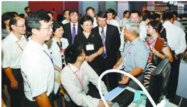
教育部副部长李卫红、福建省副省长陈桦在我校党委朱之文书记陪同下参观我校展台

以“项目·技术·资本·人才”为主题的第六届中国·海峡项目成果交易会（简称“6·18”）于6月18日-20日在福州金山展馆隆重举行。20所“985”高校及20所省内高校参会。校党委书记朱之文，副校长张颖，校长助理、发展规划办主任叶世满及科技处、资产经营有限公司等职能部门负责人，中科院院士田昭武、唐崇惕等教学科研人员120多人与会，200多项科研项目在展会上亮相。