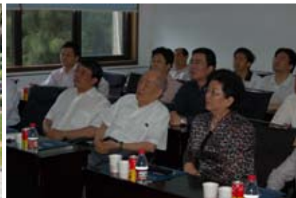
左图:2006年,诺贝尔化学奖获得者柯尔教授南强学术讲座;中图:2007年,承办第17届国际磷化学大会;右图:2008年,人大常委会副委员长陈至立莅临视察