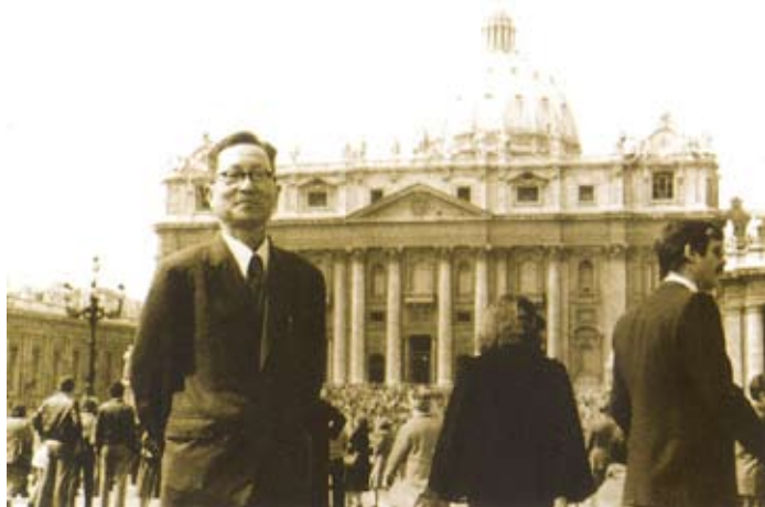
李法西教授在国外作科学考察时留影

1980年1月,他又应邀到美国加州参加美国化学海洋学的Corden Conference。会上交流了他的论文,受到了会议代表的普遍关注。