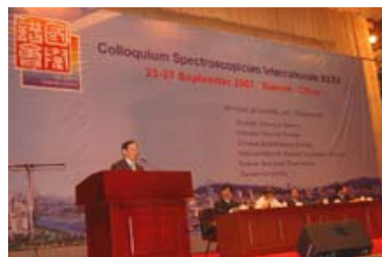
2007年,承办第35届国际光谱化学会议