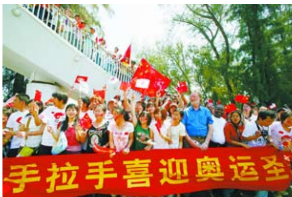
厦大师生喜迎奥运圣火

威风锣鼓喧天、五星红旗招展……厦大学生以丰富多彩的方式尽情表达对奥运的美好祝愿,展示爱国爱校、自强不息的精神风貌。各院系的方阵中,同学们以匠心独具的创意之作表达心中的喜悦;长龙呈祥,金狮献瑞,厦大舞龙舞狮队的同学为圣火的到来而欢腾起舞;外文学院的学生用英、日、法、德、俄五国语言做成的旗帜抒发着“同一个世界,同一个梦想”的情怀……一时间,师生激情迸发、厦大校园沸腾!(王瑛慧 李静)