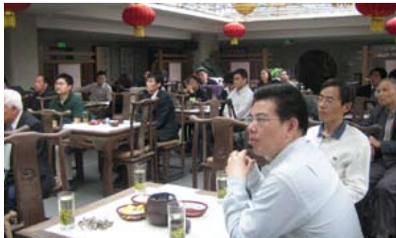
“中国发展与信息化论坛”会场

4月20日，由厦门大学北京校友会与中国信息产业商会联合举办的“中国发展与信息化论坛”在京举行。本届论坛由厦大北京校友会第五分会、中国信息产业商会信息技术应用分会联合承办。在IT、金融、法律、传媒等领域学有所成、业有所就的厦大校友及商会理事80多人齐聚一堂，就中国发展与信息化的热点问题，进行了有益交流和讨论，深受与会厦大校友和商会理事的好评。