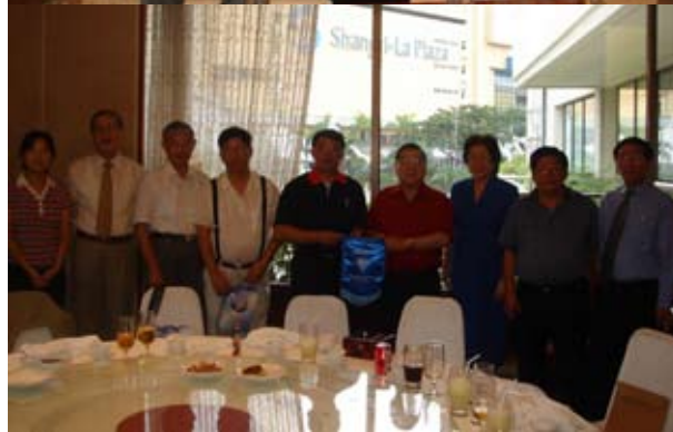
上图：访问团与新加坡校友代表合影