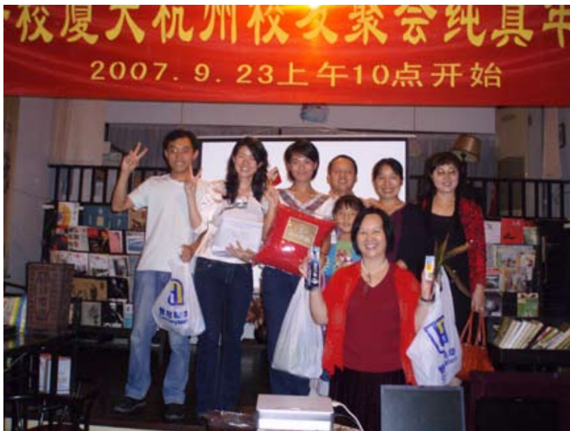
“博饼”结束，收获颇丰

月的厦门，凤凰花开，炫色醉人；9月的厦大人，在初秋开启新的学年，满是欣喜。那曾经充满向往的日子，流转到毕业后的岁月里，是惦念，是回望，是充满感慨的回忆。或如那凤凰