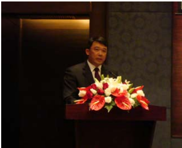
朱之文在厦大上海校友会校友企业精英联谊会上讲话

5月19日下午，在我校上海校友会的精心策划和组织下，“厦门大学上海校友企业精英联谊会”暨“上海市欧美同学会厦门大学校友分会”成立大会在上海龙之梦丽晶大酒店隆重召开，上海市委统战部副部长丁志坚，厦门大学上海校友会理事长陈鹏生，上海市欧美同学会沈志钦常务副会长，厦门大学上海校友会顾问、福建省驻沪办主任陈振环等领导嘉宾与100多名企业精英校友和留学归国校友欢聚一堂，共庆联谊会的成立。我校党委书记朱之文率校友总会副理事长、法学院院长廖益新，管理学院党委书记黄福才等专程到会祝贺。