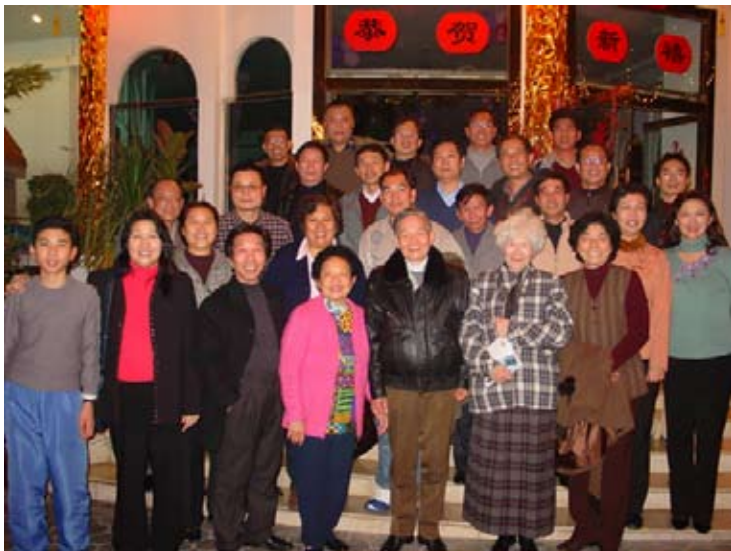
2005年，在厦的同学与当年的老师聚会