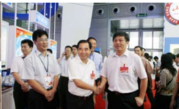
副省长叶双瓊（中）到我校展区视察指导

10月17日下午，第九届高交会在深圳会展中心胜利闭幕。我校继第八届高交会之后，再次获得优秀组织奖、优秀展示奖与优秀产品奖全部奖项。此外，我校组团申报的“优质早籼稻新品种应用”项目、我校与厦门养生堂生物技术有限公司合作研发的“重组戊型肝炎疫苗”项目都获得了优秀产品奖。