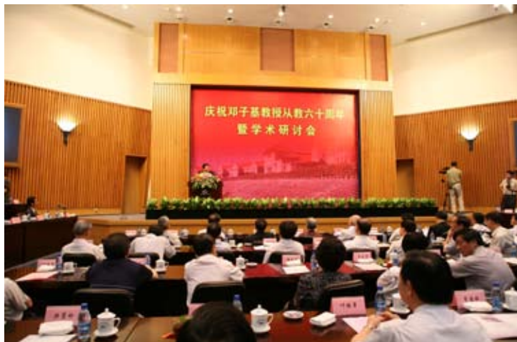
邓子基教授从教60周年庆祝会暨学术研讨会