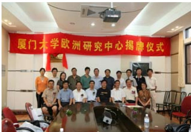
参加揭牌仪式的与会人员合影留念