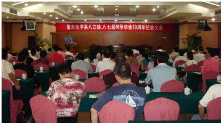
化学系1983级毕业20周年纪念大会会场

信守10年前的约定，化学系83级的同学们带着不尽的怀念与感恩情谊，于2007年10月3日至6日返回母校团聚。