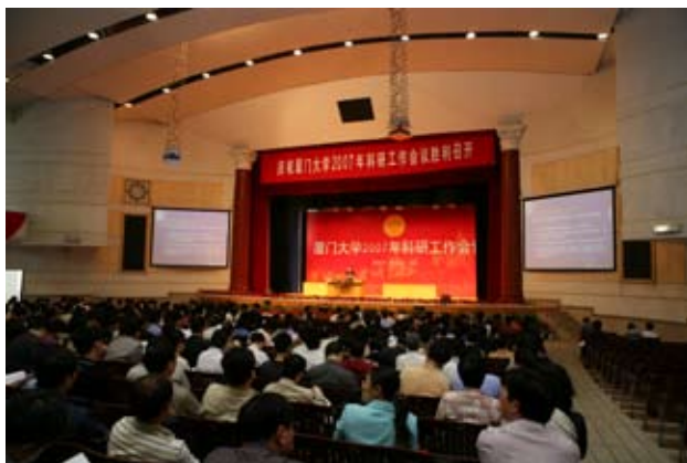
厦门大学2007年科研工作会议会场