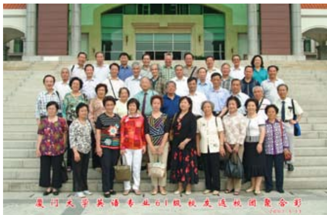
1961级英语专业校友在嘉庚广场前合影留念

会后，校友们在当年的宿舍、教室前合影留念，仿佛囊萤映雪的时光仍然在缓缓流淌，仿佛那朗朗读书声仍然在耳畔回荡。