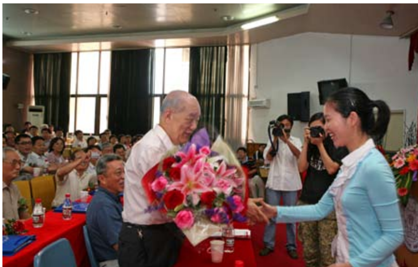
学生代表给田昭武院士敬献鲜花