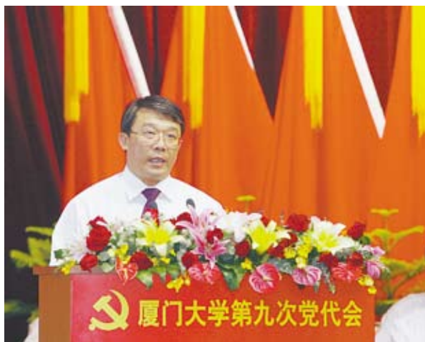
朱之文在厦门大学第九次党代会上做工作报告