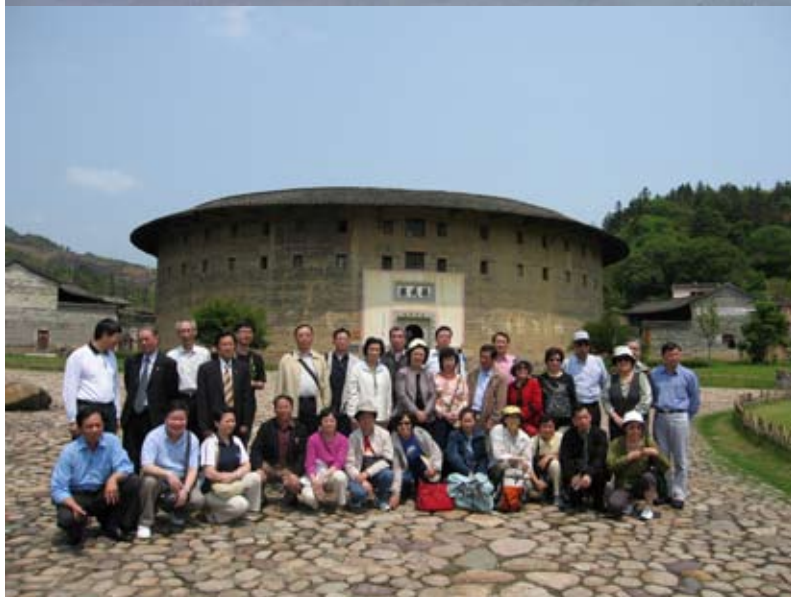
上图:2005年12月,旅港校友组织到台湾旅游观光;