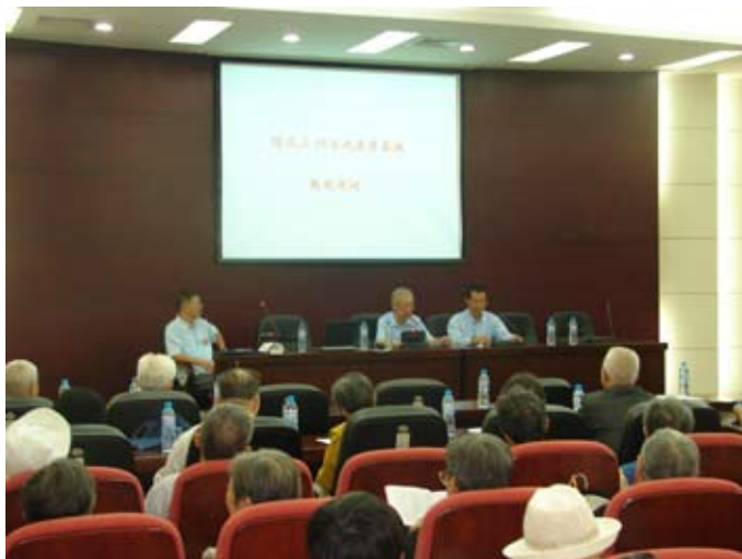
第27届校友毕业55周年纪念大会

聚会中一再高唱的《难忘今宵》、“白发银须情更浓,共祝祖国更富强”、“望自珍重保安康”,歌声寄情,激荡着每个人的心!