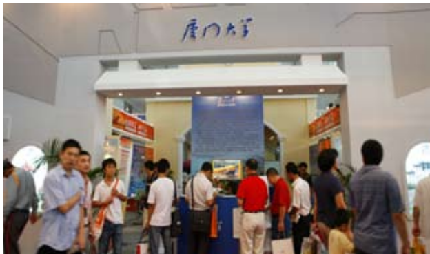
第九届高交会厦门大学展区