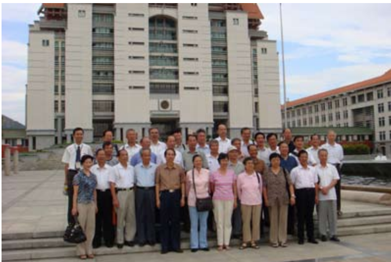
会计1963级校友在漳州校区主楼群前合影留念

相聚是短暂的，他们有说不完的话语，三个晚上建文楼里他们房间的灯光亮到了深夜。他们相