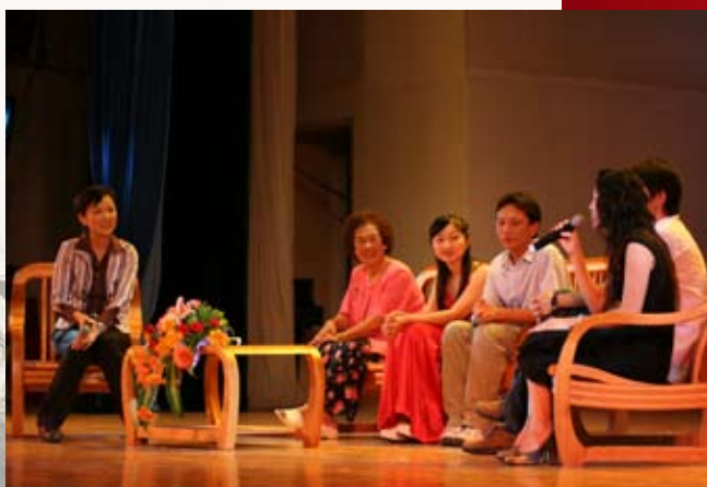
晚会特别设计的校友访谈环节