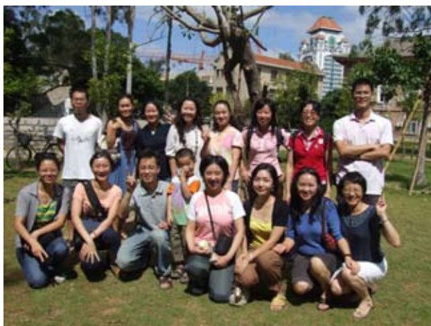
1993级国会班校友在捐赠的大榕树前合影

活动当日，同学们自发地组织捐款，并在校友总会的帮助下，在校园内的空绿化地上你一锄我一锄地种下了一棵大榕树。这棵珍贵的榕树，既表达了93国会班同学们对昔日校园生活的深切纪念，更寄托着同学们希望回报母校栽培之恩、并与母校一同成长的心意。（张晓云）