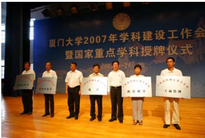
朱之文（左三）、朱崇实（左五）为国家重点学科授牌

关于学科建设工作，朱之文强调指出了六点意见：一要深刻认识学科建设的重要意义；二要科学制定学科建设规划；三要着力构筑高水平学科平台；四要精心打造高素质学科队伍；五要大力推进体制机制创新；六要提供资金和硬件保障。朱之文希望，全校各级领导和教师都积极参与到学科建设中来，全力以赴、积极进取，努力开创我校学科建设的新局面。（李静）