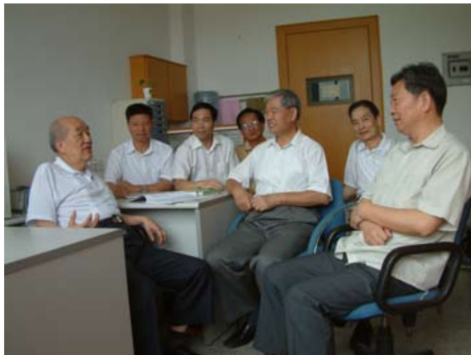
田昭武院士（左一）与课题组老师们在一起

创新是科学的灵魂。田昭武常说：“在科学上一定要创新，不可步人后尘，科学的魅力就是创新”。他在电化学研究中十分注重创新，首先是理论上的创新，提出自己的理论模型，把它看