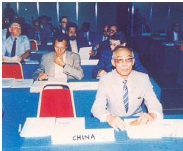
1989年代表我国土力学及基础工程学会参加第11届国际土力学执委会（巴西）

在国内举行的国际会议中，曾国熙教授多次担任组织、顾问、大会主席、分组主席等。1990年获伊朗首届国际土力学及基础工程研讨会荣誉奖。为促进国际学术交流作出贡献。